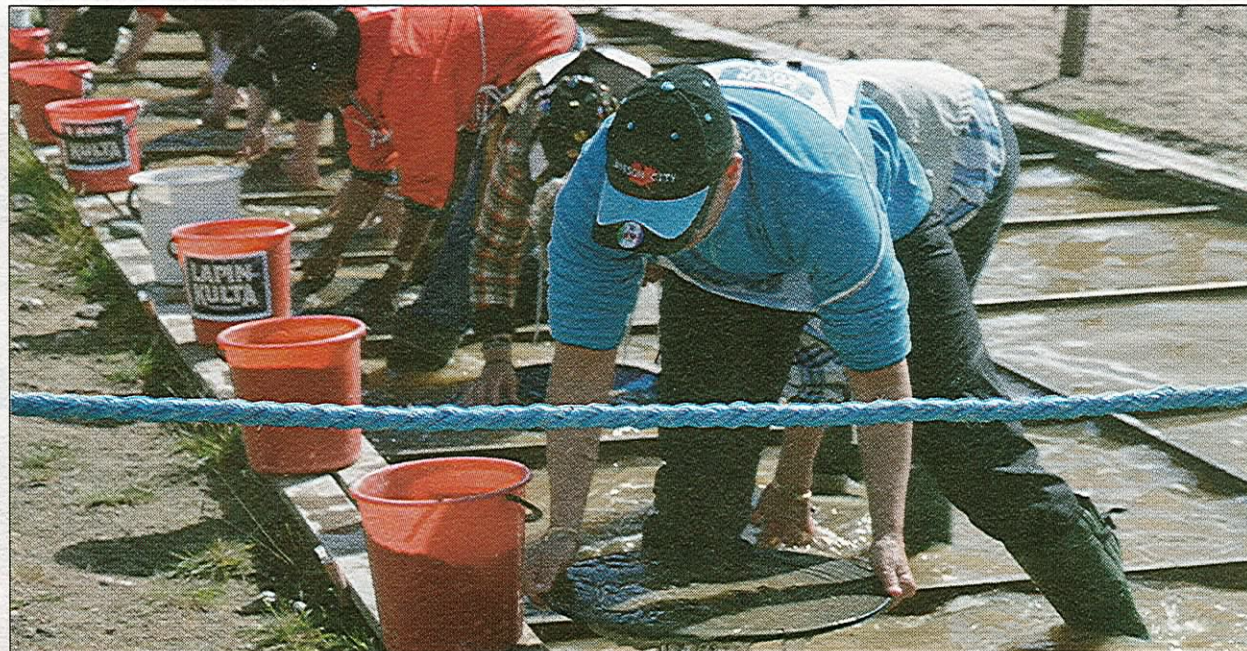
GULDCHANS. Deltagarna i svenska mästerskapen i guldvaskning tävlade om vem som kunde vaska fram flest guldkorn på kortast tid.