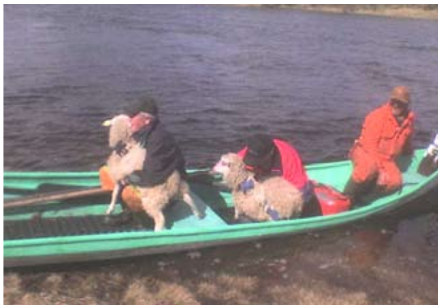
Våra "grabbar" flyttar fåren

Tackorna och tjejlammen får gå och beta här i byn. Då har vi kvar några i byn, som vi kan klappa och mata nu i sommar.