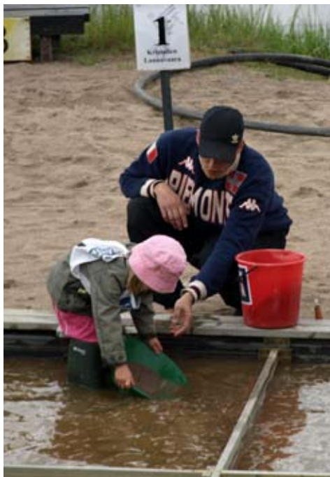
Yngsta nybörjaren 2008