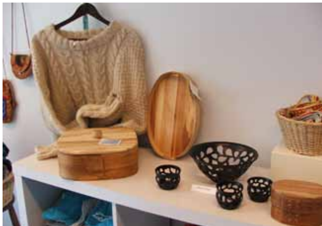
Hantverksbutiken i Lannavaara

Då var det åter dags för en guldvaskarhelg i Lannavaara. I samband med det ordnas hantverksmässa under lördagen.